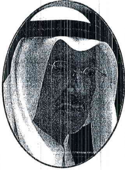
الأمير طلال بن عبد العزيز آل سعود