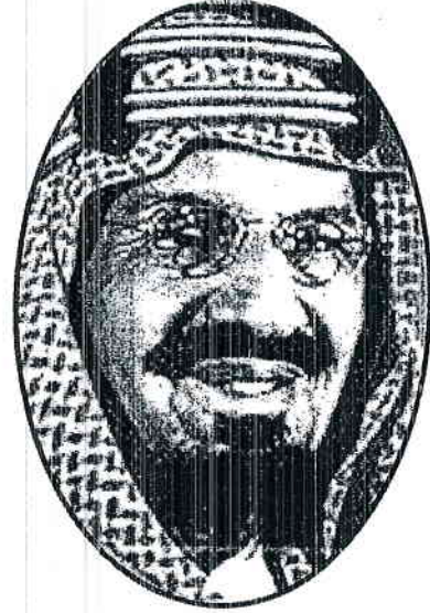
الملك عبد العزيز آل سعود

بمبادرة من صاحب السمو الملكي الأمير طلال بن عبد العزيز رئيس المجلس العربي للطفولة والتنمية، ومن منطلق اهتمام سموه بقضايا الطفولة والتنشئة والمواطنة باعتبارها قضايا ذات أولوية لتنشئة الطفل في البلدان العربية بغرض تكوين إطار فكري إسترشادي لتنمية الأطفال في المجتمعات العربية، يقوم المجلس العربي للطفولة والتنمية بإنشاء جائزة في مجال البحث الاجتماعي والتربوي لتقديم دراسات وبحوث علمية حول قضايا الطفولة والتنمية ودعم حق الطفل في المشاركة والحماية.