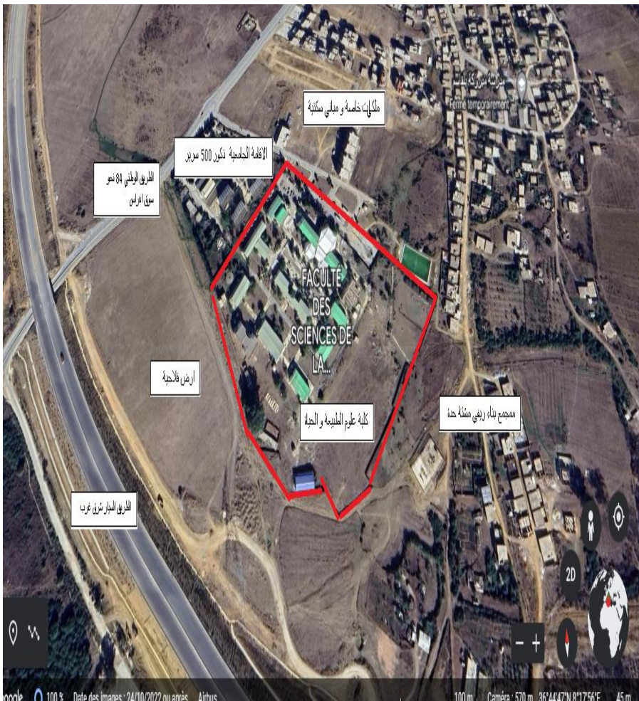
الموقع الثاني: كلية علوم الطبيعة و الحياة طريق المطروحة على خرائط قوقل 36°44'55"N 8°17'57"E